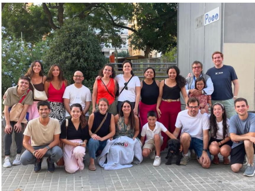
Ilustración 3: Parte del equipo de voluntarios del proyecto Chocolate un domingo por la tarde, listos para

Trabajo en equipo: Cada salida involucra tareas previas como la preparación de alimentos y la adquisición o recolección de bienes de primera necesidad, organizadas por distintos equipos de voluntarios. Durante las salidas, nos aproximamos a las personas en grupos de 2 o 3 voluntarios para facilitar el trato y generar un acercamiento personal. La coordinación entre los diferentes equipos es fundamental para el éxito de cada salida. Las actividades abarcan desde la preparación de termos y la confección de bolsas para cada ruta, hasta la gestión de peticiones semanales, donaciones puntuales y la reparación de materiales esenciales. Este proceso requiere dedicación y una gestión eficiente del tiempo, que solo es posible mediante un equipo comprometido y basado en la confianza y colaboración mutua.